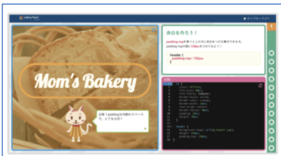
▲テキストコーディングの画面