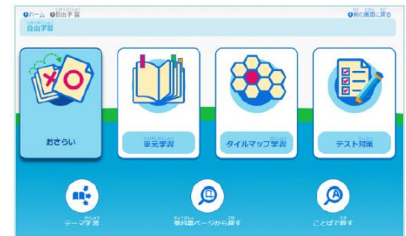
▲「おさらい」「テスト対策」の追加