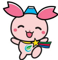
ふじみ野市 PR 大使 「ふじみん」

令和6年度からのGIGAスクール第2期に向け、 これまでの教材アプリを見直し、新規導入します！