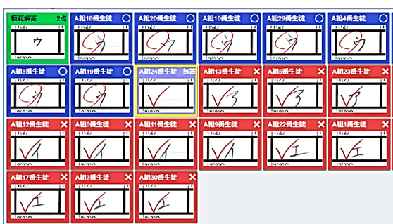
▲AI による自動採点画面