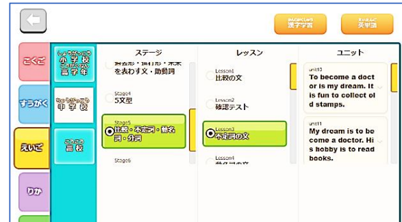
▲学習者による問題選択画面